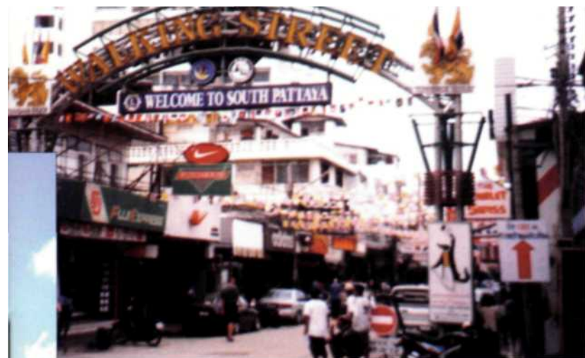
South Pattaya (oben) ist ein reines Vergnügungsviertel. Bei Tage merkt man davon allerdings wenig

und Service für Touristen und Residenten. 2.500 Exemplare des 32 Seiten starken Blattes vertreiben wir pro Ausgabe. Mit der Zeitung halten wir uns gerade so über Wasser. Aber es macht auch Spaß, ein gutes journalistisches Produkt zu erstellen, gut recherchiert und mit modernem Layout. Einfach ist es allerdings nicht: Bürokratische Schikanen und die ausgesprochene Selbstbedienungsmentalität der thailändischen Behörden machen jeden offiziellen Weg zu einer Tortur.